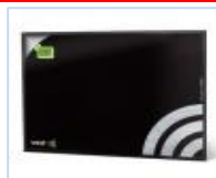
← 電磁波対策ノートパソコン用シールド →