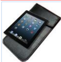
↑ iPad 電磁波シールドソフトケース ↑

小型ノートパソコンなどに使用できます。iPad、その他モバイル機器など使用時には、強力なマイクロ波が出ています。膝の上に置いて使用される方は注意が必要で、このiPad 電磁波シールドソフトケースをお勧めします。