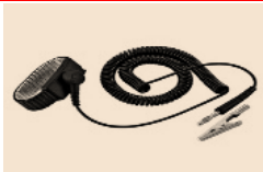
↑ 静電気除去プレスレット

(1) 身に着けるだけで外部からの静電気を除去し、身体に蓄電された静電気を激減できます。効果的な帯電・電磁波低減商品です。但し、付属のアースケーブルでアースを取ることが必要です。