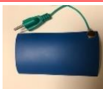
↑ 3ピンプラグのアースケーブル付