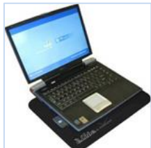
↑ ノートパソコン用磁場シールドパッド

ノートパソコン使用時には、ノートパソコンの本体の裏側から、強力な磁場と熱が放射されています。ノートパソコンを膝の上に置いて使用される方は注意が必要です。ノートパソコンを使用する方に、このノートパソコン用磁場シールドパッドをお勧めします。この磁場シールドパッドをパソコンの下に敷くだけで、磁場放射を約80%減衰します。