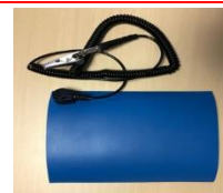
↑ わにぐちクリップ端子付アースケーブル

※3.1.4: 引用サイト: 静電気除去(アースing)ミニパッド<<【MS335mini】